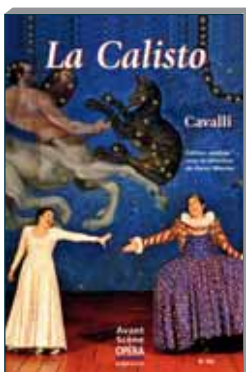
N° 254 janvier-février 2010