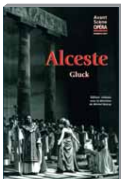
N° 256 mai-juin 2010