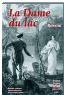
N° 255 mars-avril 2010